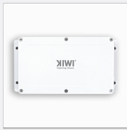
KIWI Gateway (GW-N-X)